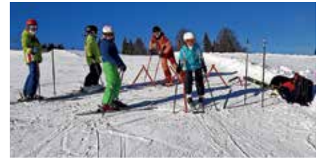
Foto: Entspanntes Skifahren am Feldberg - Fun-Gruppe im Winter 2022.